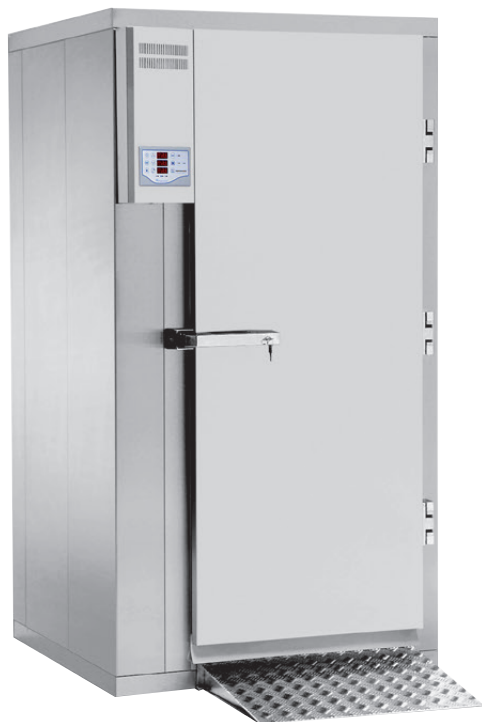
Roll In BC/BF 960 Blast Chill/Blast Freeze

NB! Må tilkoples avløp. Kan leveres med HACCP utstyr. Roll In rom for sentralkjøøl leveres uten kompressoraggregat, med magnet- og ekspansjonsventil for R452.