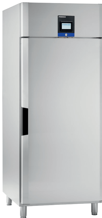
Inventus BC/BF 8