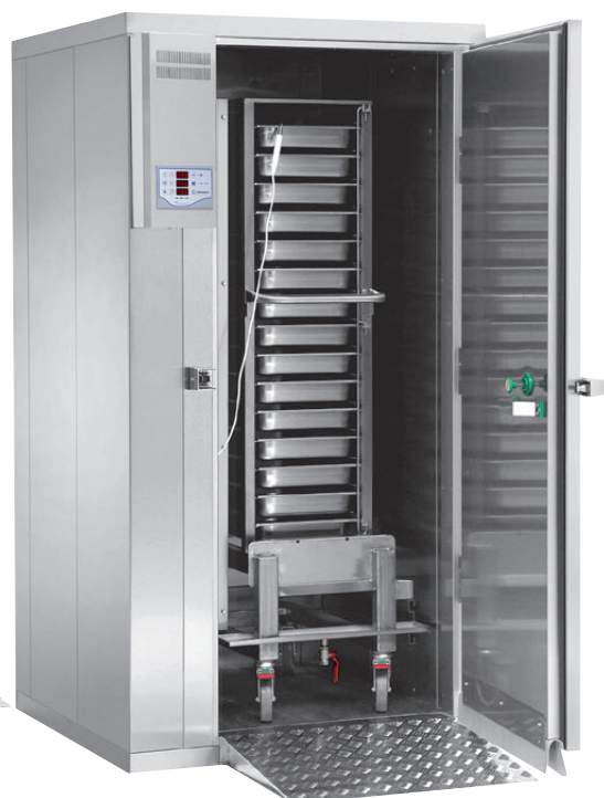
Roll In BC/BF 990 Blast Chill/Blast Freeze