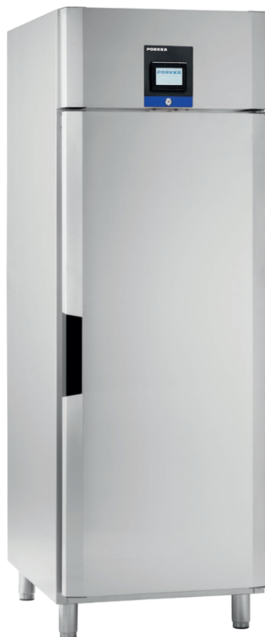
Inventus BC/BF 7