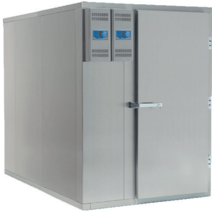
Roll In BC / BF 48-200 Blast Chill / Blast Freeze