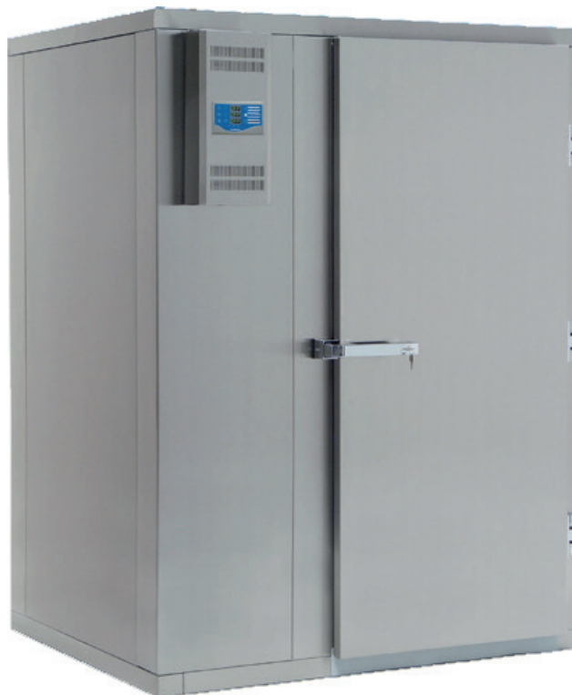
Roll In BC / BF 24-100 Blast Chill / Blast Freeze

Roll In rom for sentralkjøll leveres uten kompressoraggregat, med magnet- og ekspansjonsventil for R452.