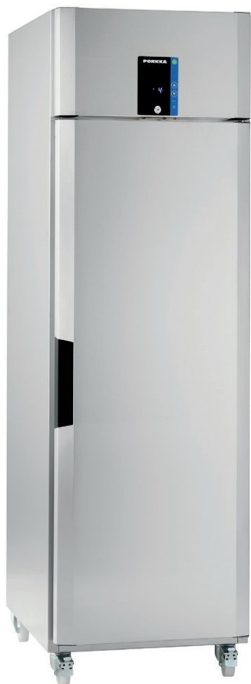
Inventus DF 6