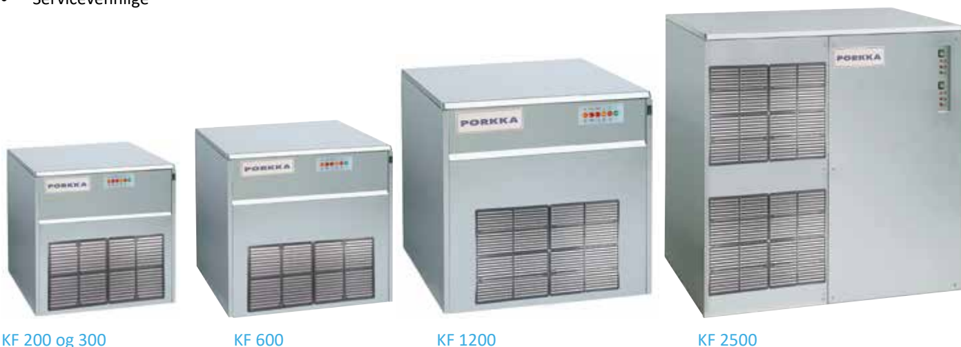
KF 200 og 300