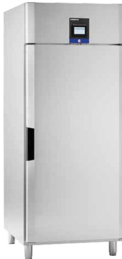
Inventus BC/BF 8