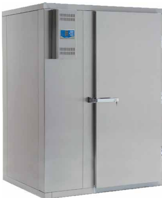
Roll In BC / BF 24-100 Blast Chill / Blast Freeze

Roll In rom for sentralkjøll leveres uten kompressoraggregat, med magnet- og ekspansjonsventil for R452.