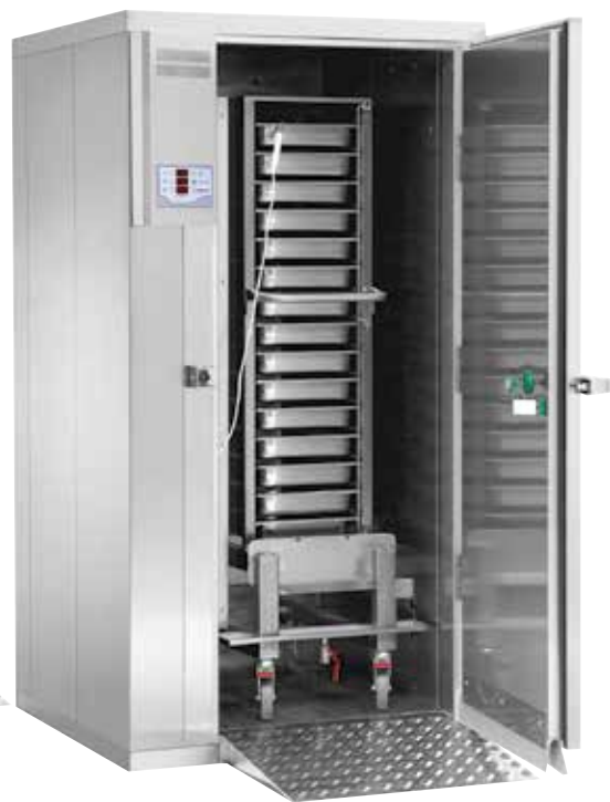
Roll In BC/BF 990 Blast Chill/Blast Freeze