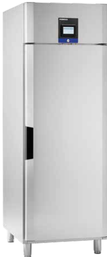
Inventus BC/BF 7