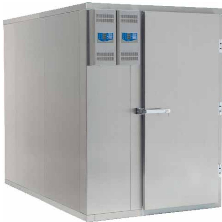
Roll In BC / BF 48-200 Blast Chill / Blast Freeze