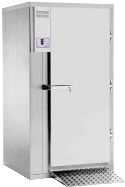
Roll In BC/BF 960 Blast Chill/Blast Freeze

NB! Må tilkoples avløp. Kan leveres med HACCP utstyr. Roll In rom for sentralkjøøl leveres uten kompressoraggregat, med magnet- og ekspansjonsventil for R452.